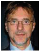
prof. dr. Velimir Srića

Proces učenja nema za cilj naučiti, već vječno istraživati novo i nepoznato. Zato moramo biti skromni prema onome što znamo, a znatiželjni i otvoreni prema onome što još ne znamo. O tome govori sljedeći savjet: Tko ne zna i ne zna da ne zna, dijete je, odgoji ga. Tko ne zna i zna da ne zna, budala je, kloni ga se. Tko zna i ne zna da zna, spava, probudi ga. Tko zna i zna da zna, mudrac je, slijedi ga!